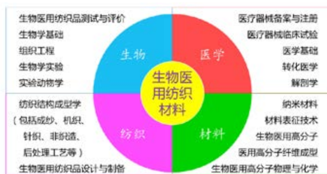
图1 生物医用纺织材料专业课程体系